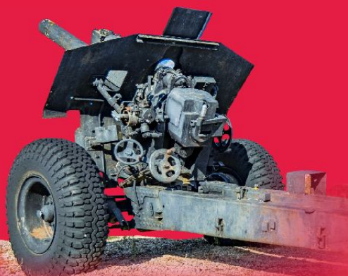
MUZEUM MILITARIÓW MILITARY & HISTORY ZONE