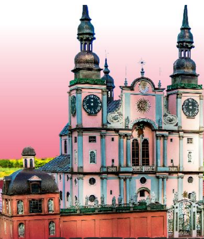
PARK MINIATUR MINIATURE PARK