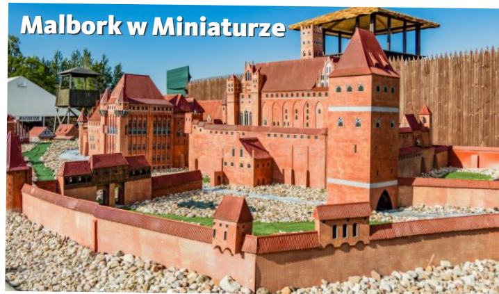
Malbork w Miniaturze