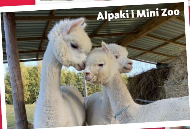
Alpaki i Mini Zoo